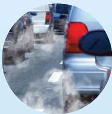
CO 2 reglering