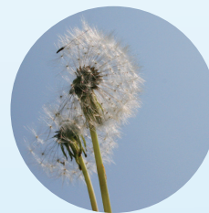
Radiatorreglering med utekompensering